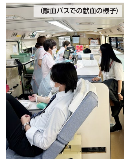
(献血バスでの献血の様子)

現代は、医療技術がどんどん進歩しています。しかし、血液は人工的に造ることができません。だから「献血」でたくさんの人から協力をいただき、血液を集めるしかないのです。