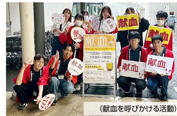
(献血を呼びかける活動)

輸血を受けている患者さんの数なんです。毎日こんなに多くの患者さんが、血液を必要としています。