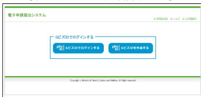
【本システムのログイン画面イメージ】

本システムでご利用できるGビズIDのアカウント種類は、「gBiz IDプライム」と「gBiz IDメンバー」のみになります。