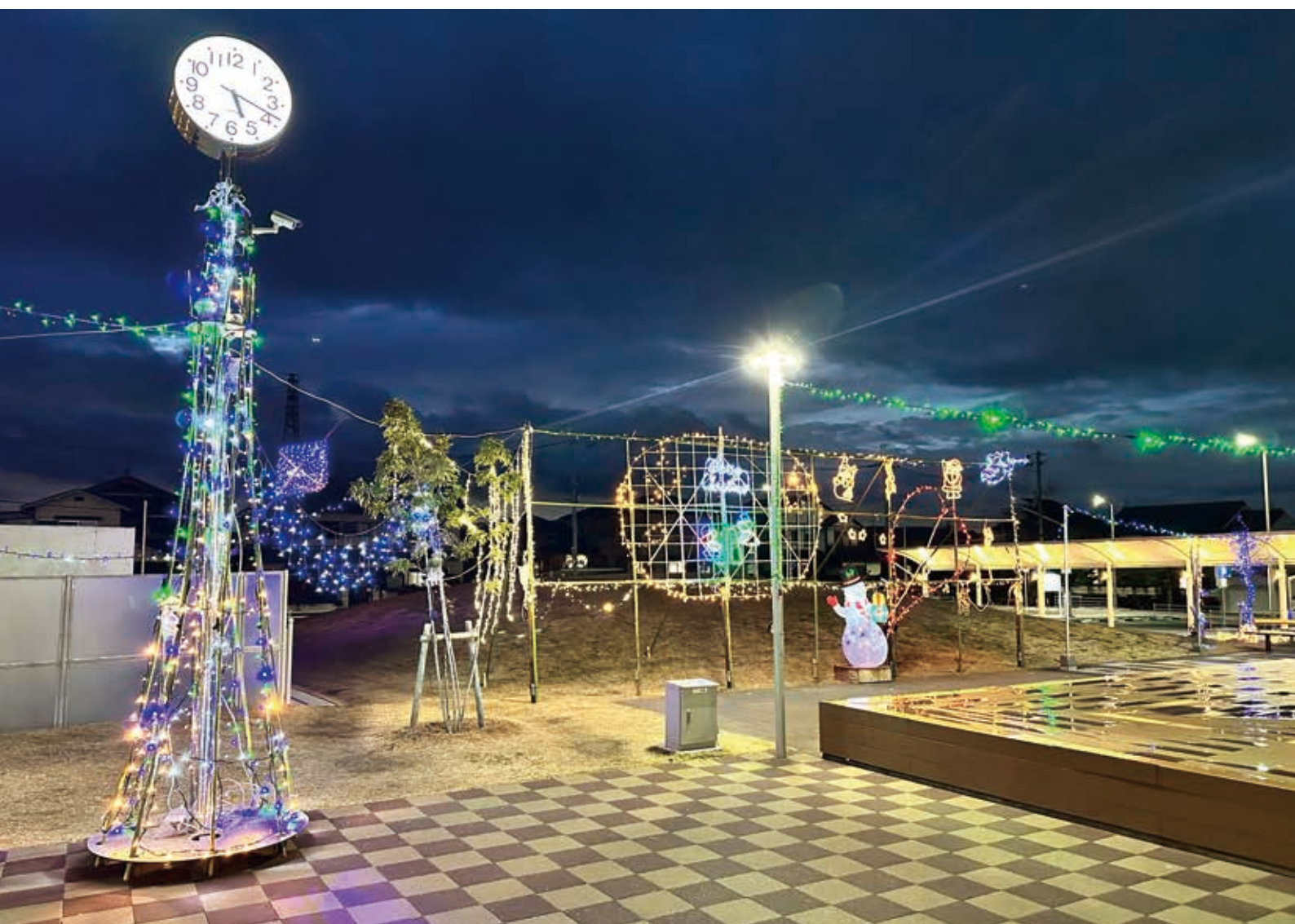
駅前イルミネーション