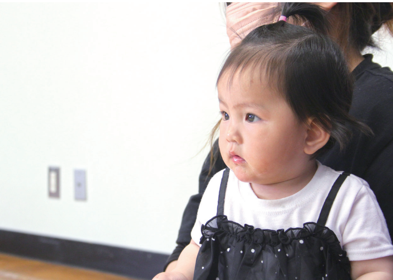
10か月児相談の様子