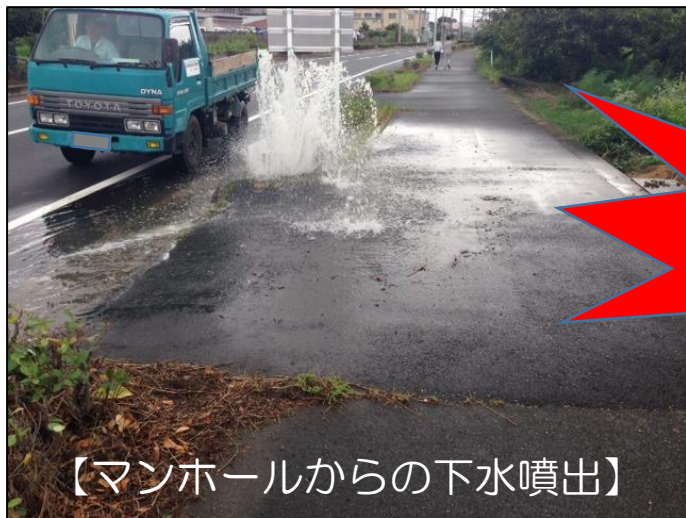
【マンホールからの下水噴出】

【原因】 雨水を流す雨樋などの排水が、「污水管」につながれていることや雨天時に汚水ますの蓋を開けて宅内の雨水を排水していること等が原因です。