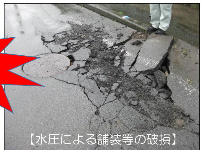
【水圧による舗装等の破損】