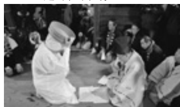
子出来おんだ祭りのようす (妊婦と神主の問答)