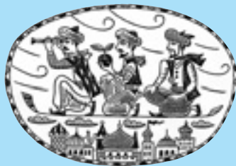
「空飛ぶじゅうたん」