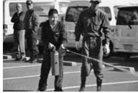
磯城消防署の指導のもと消火器による消化訓練