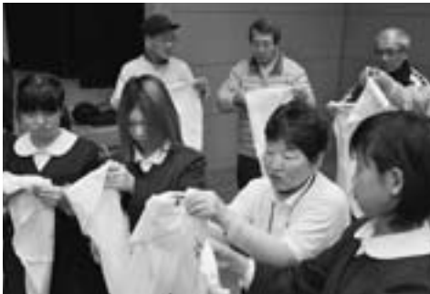
三角巾を使用したケガの応急手当対応の講習