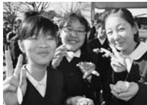
水やお湯だけで出来るご飯「アルファ化米」をみんなで試食