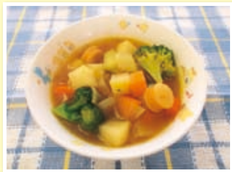
1人分エネルギー …… 129 kcal