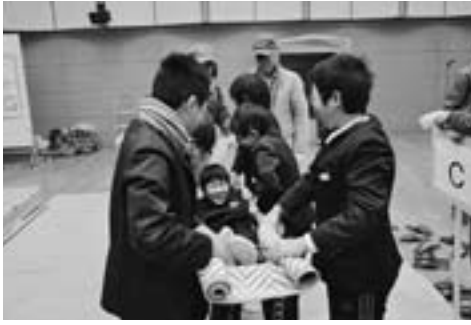
毛布と竹の棒で簡易担架を作成し、安全に運搬する方法の講習