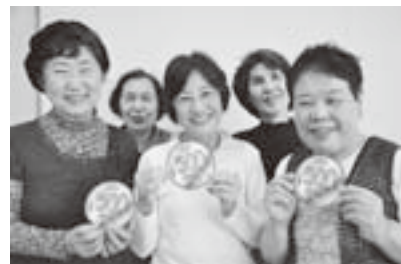
健康体操サポーターの皆さん

希望する医療機関に健診受診を申し込んでください（登録医療機関であれば受診可能です。詳しくはお問い合わせください。）