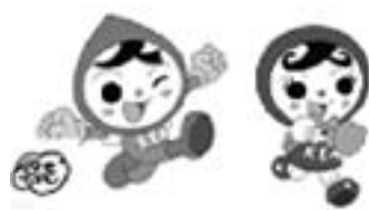
人権イメージキャラクター 人KEN まもる君 人KEN あゆみちゃん

私たちの日常生活には人権に関わつた（女性・子ども・高齢者・障害のある人・同和問題・在日外国人に対する差別など）問題が存在しています。川西町ではあらゆる人権問題解決の一環として、弁護士による無料法律相談を左記の日程で開催します。（1人約30分）