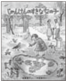
松岡 享子さく 学研教育出版

「ジャンけんのすきな女の子」 あるところに、ジャンけんのすきな女の子がいました。誰とでも何を決めるにもジャンけん。相手がいない時は一人でジャンけん。ある日、猫とジャンけん勝負をすることに…。女の子は猫に勝てるのでしょうか？ 読んでもらえば5・6才から。